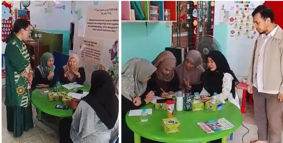
Gambar 1. Bimbingan Diskusi Kelompok

Berdasarkan hasil paparan masalah dan solusi tersebut, peserta workshop PTK berbasis praktik reflektif dapat mengidentifikasi permasalahan dan cara penyelesaiannya. Permasalahan yang dikemukakan oleh kelompok 1 mengenai konsentrasi anak yang pendek pada saat proses pembelajaran, anak mudah untuk mengalihkan konsentrasi dari topik atau kegiatan yang direncanakan guru. Hasil diskusi menemukan solusi yang perlu diupayakan dalam penyelesaian masalah berupa ice breaking , nyanyi, jenis tepuk anak. Pada kelompok 2 menemukan masalah yaitu terdapat anak yang masih malu, tantrum, tidak mau bermain bersama, sehingga ditarik kesimpulan yaitu terdapat permasalahan pada perilaku sosial. Solusi yang diajukan yaitu dengan mengadakan kegiatan parenting bersama orang tua, kegiatan ini berfokus pada strategi guru dalam merancang, melaksanakan, dan merefleksikan pembelajaran, termasuk melakukan kolaborasi guru dengan orangtua. Guru mengajak kerjasama orangtua untuk melaksanakan dan memperkuat implementasi pembelajaran yang telah diberikan di kelas. Sehingga keterlibatan orang tua berfungsi sebagai penguatan tindakan kelas yang telah dirancang oleh guru.